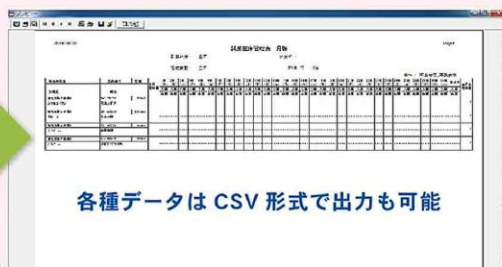
試薬在庫管理表 月報画面▶