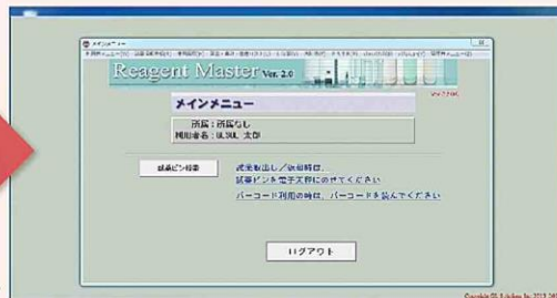
メインメニュー画面▶