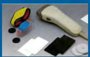
MIDAT/バーコード対応 ハンディリーダライタMDH-100と対応タグ

株式会社 エイアイテクノロジー設立 アリムラ技研株式会社の営業権を譲渡され事業をスタート。ミクロン(現在NXP)との技術提携によるMIFAREをはじめ、その他の無電源方式ICカードシステムの国内導入を開始する。